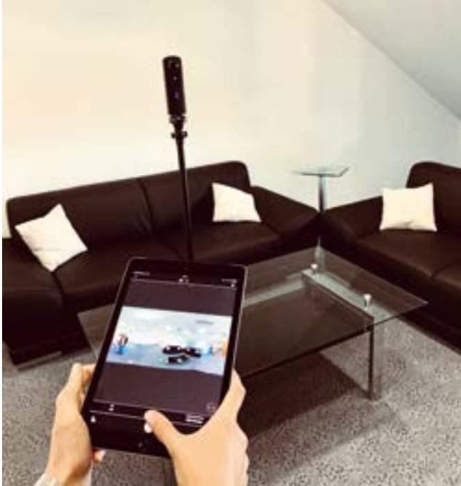
Fernsteuerung per App: Die Kamera wird aus dem Nebenraum mit einem Tablet oder Smartphone bedient, um die Fotos für den Rundgang zu erstellen.